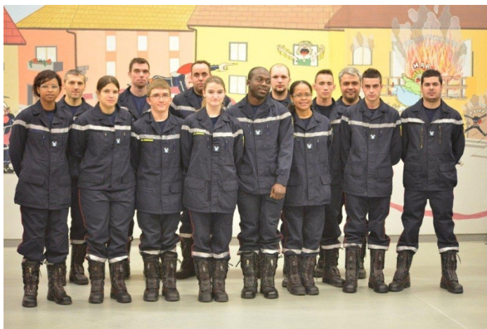
La relève 2013